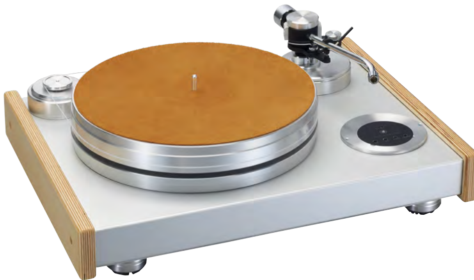
Solid Vintage System