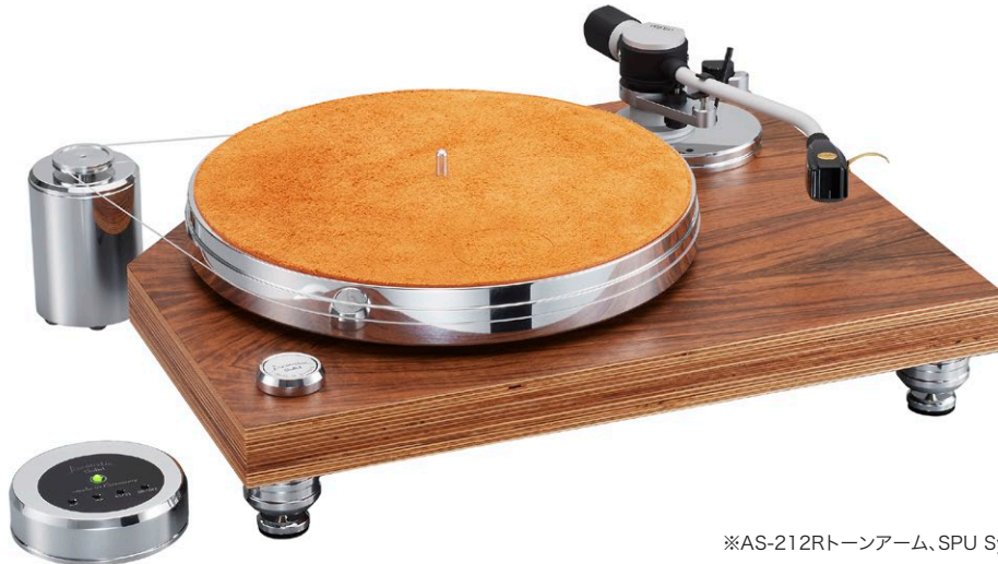
※AS-21 2Rトーンアーム、SPU Synergy(別売)取付時

本機のキャビネットには、高級スピーカーのエンクロージャーなどにも多用されるパチ材の積層合板を採用。木材特有の「Acoustic」な響きを残しながら「Solid」でもあるという理想的な特性をもつこの素材のキャビネットは、社名として掲げたサウンドフィロソフィーに最も相応しいとされて特別に製作されました。また、かつてのモデルではシャープなヘアライン加工であった金属部品の表面は、Acoustic Solid社の得意とするポリッシュ（鏡面）加工へとアップグレードされました。熟練の職人がひとつひとつ手作業で磨くプラッターは、ドイツ人が世界に冠たるものと誇るクラフトマンシップの象徴です。